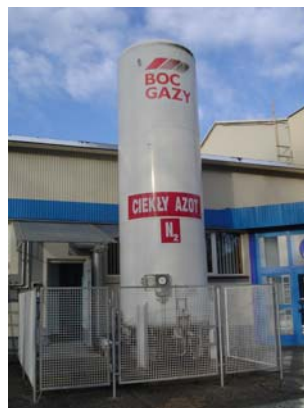
Kriokomora, zbiornik z ciekłym azotem, Creator Wrocław